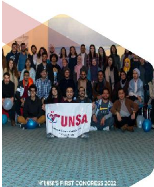
UNSA'S FIRST CONGRESS 2022

In 2023, the association took the initiative to establish clubs within Tunisian universities to facilitate access to the field for students. Our branch, affiliated with TUNSA, is housed within ENSI, where all space enthusiasts come together to deepen their understanding and passion for the cosmos. Our mission is to equip ENSI's students with experience and knowledge in space, thereby aiding Tunisia's advancement in the global space industry. We strive to be a place where everyone, regardless of background, can delve into the fascinating realm of space, encouraged to learn, explore, and share ideas in an inclusive and collaborative atmosphere.